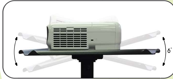
ป้องกันเสาได้ 6 องศา