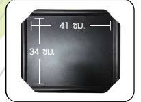
ถาดวางโปรเจกเตอร์