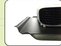
ป้องกันโปรเจกเตอร์ ใส่วางหลัง