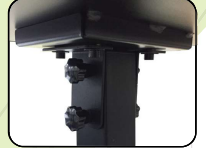
ระบบล้อเคลื่อน 4 ตัว