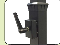
ปรับความสูงในระดับที่ต้องการ