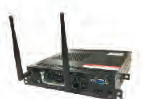
PC Module (OPS)