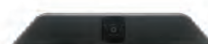
Webcam Full HD Camera