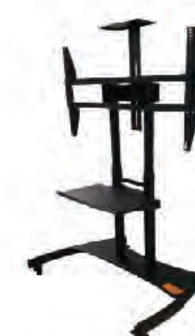
ขาตั้งแบบล้อเลื่อน ( F Series )